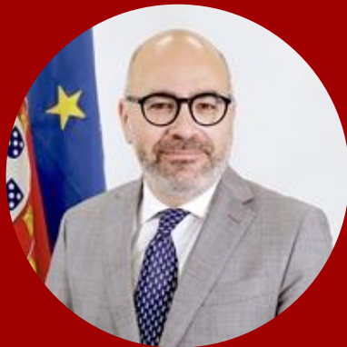
Miguel Pinto Luz MINISTRO DAS INFRAESTRUTURAS E HABITAÇÃO