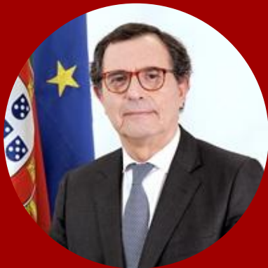
Manuel Castro Almeida MINISTRO ADJUNTO E DA COESÃO TERRITORIAL