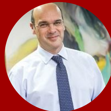
Pedro Siza Vieira ANTIGO MINISTRO DA ECONOMIA E ATUAL SÓCIO DA PLMJ NAS ÁREAS BANCÁRIA, FINANCEIRA E MERCADO DE CAPITAIS