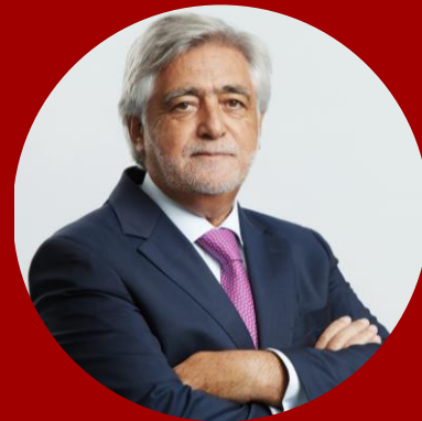
Luís Amado ANTIGO MINISTRO DA DEFESA E DOS NEGÓCIOS ESTRANGEIROS, ESPECIALISTA EM GEOPOLÍTICO MUNDIAL